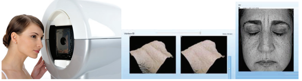
3D - fonksiyonu